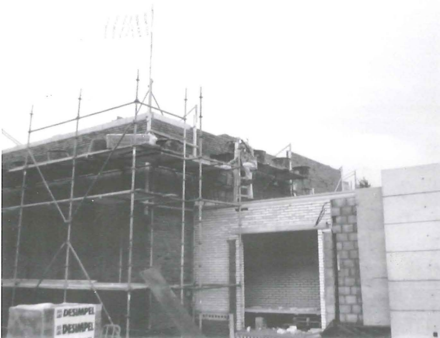
Het gaat nu echt gebeuren: 12 februari 1999 wordt de SooS officieel geopend. Om dit te vieren wordt er 's avonds een groot feest georganiseerd met een bekende band.